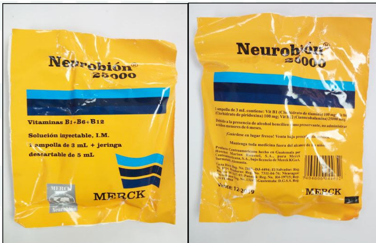
Imagen N° 1. Fotografías de la bolsa de Neurobion Falso.

El medicamento falso es una ampolla de vidrio color ámbar que viene empacada junto con una jeringa desechable en una bolsa amarilla de papel rotulada como “Neurobión® 25000”. Esta bolsa trae impresos varios datos que también son falsos como por ejemplo el número de registro sanitario para Honduras (Reg. 7311-04-76).