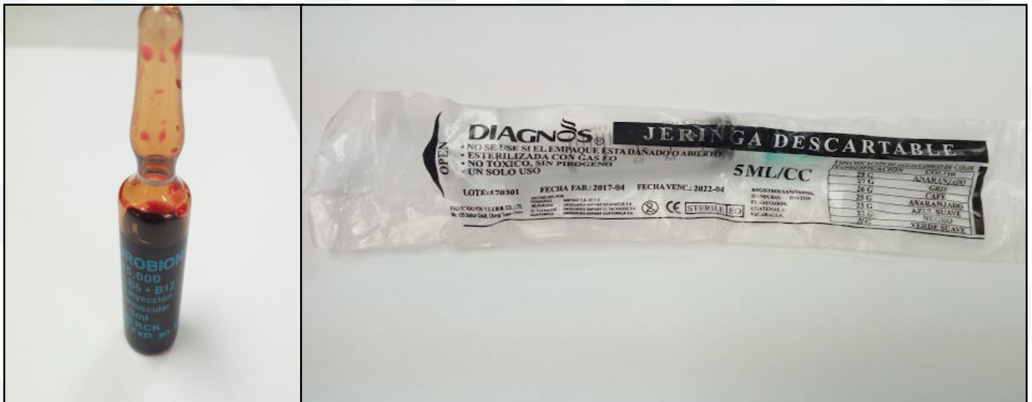
Imagen N° 2. Fotografías de la ampolla y jeringa de Neurobion Falso.